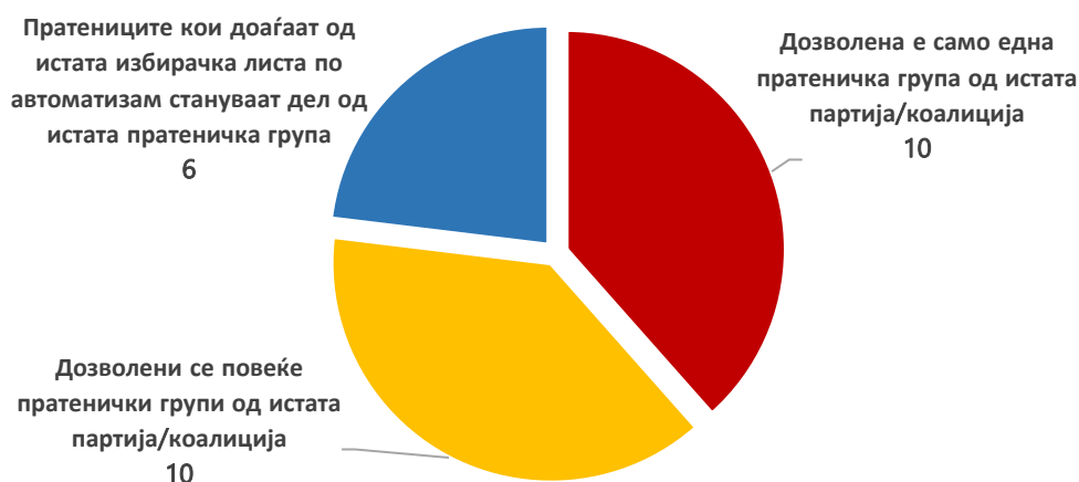
Графикон 2: Можност за формирање на пратенички групи од иста политичка партија/коалиција

Уште едно интересно прашање по кое се разликуваат државите е тоа дали пратениците кои припаѓаат на иста политичка партија/коалиција може да формираат повеќе пратенички групи или дозволено е само по една пратеничка група од пратениците кои припаѓаат на иста партија/коалиција. Во десет од државите во правилата е конкретно напишано дека пратениците кои доаѓаат од иста партија/коалиција може да формираат само една пратеничка група . Такви се случаите на Шпанија, Романија, Естонија, Летонија, Чешката Република, Унгарија, Австрија, Република Ирска, Словенија и Хрватска. Дополнително, во оние држави во кои пратеничките групи ги следат линиите на политичките партии/коалиции, иако не е конкретно дефинирано, се подразбира дека една партија/коалиција може да формира само една пратеничка група во парламентот. Такви се случаите на Португалија, Данска, Шведска, Финска, Грција и Кипар.